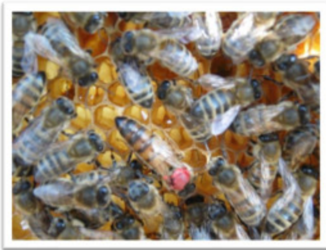
La reine est marquée pour la retrouver facilement

La ruche est composée d'une reine, de ses ouvrières et de couvain (œufs, larves) qui composent la colonie. L'abeille vit environ 30 jours à l'exception de celle d'hiver qui vit 3 mois.