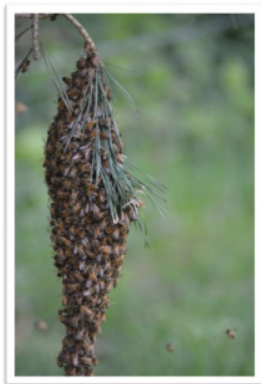
Essaimage, une partie de la colonie s'est rassemblée autour de la reine sur une branche

Au plus fort de la saison, cela peut entraîner un essaimage . Phénomène observé quand la reine et une partie des abeilles (l'essaim) quittent la ruche pour former une nouvelle colonie à la recherche d'un endroit propice pour s'établir et reformer une colonie.